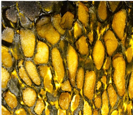
PISOLITHUS ARHIZUS Detail der Gleba | détail de la gleba