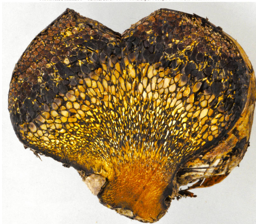
PISOLITHUS ARHIZUS Schnitt durch den Fruchtkörper | coupe à travers la fructification