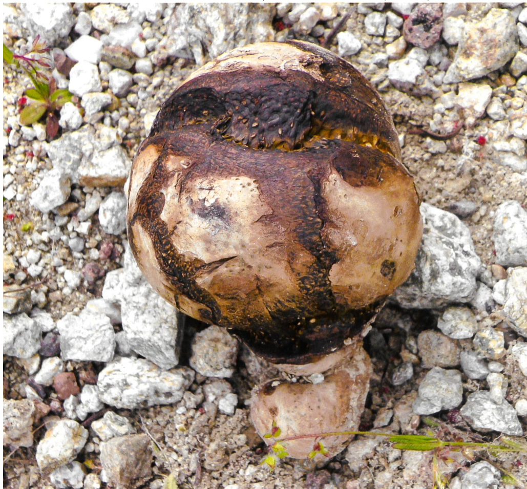
PISOLITHUS ARHIZUS Fructification (exemplaire de la Corse) | Fruchtkörper (Exemplar aus Korsika)