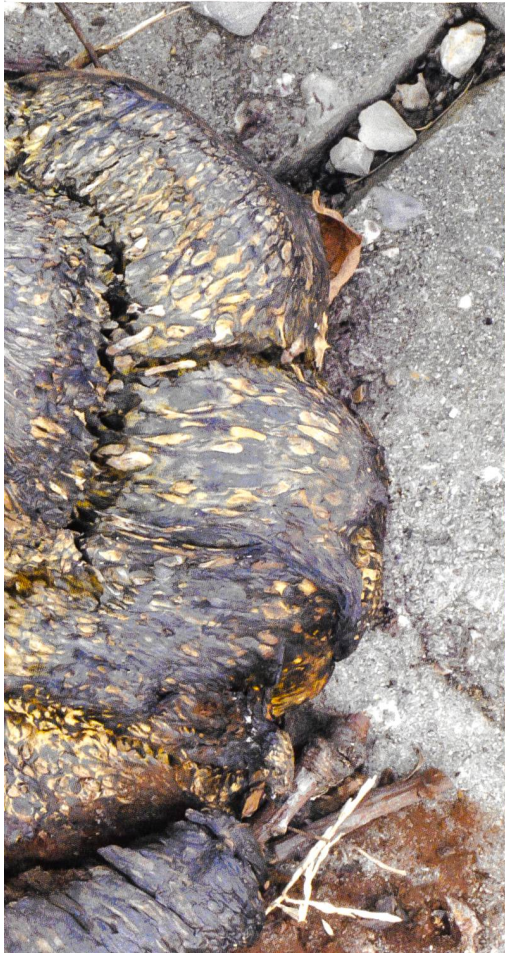
Fruchtkörper (Exemplar aus Morges)