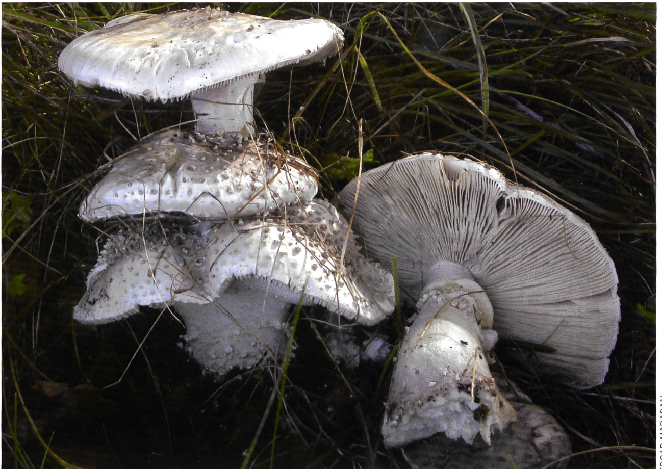
AMANITA ECHINOCEPHALA Stachelschuppiger Wulstling | Amanite à squames pointues