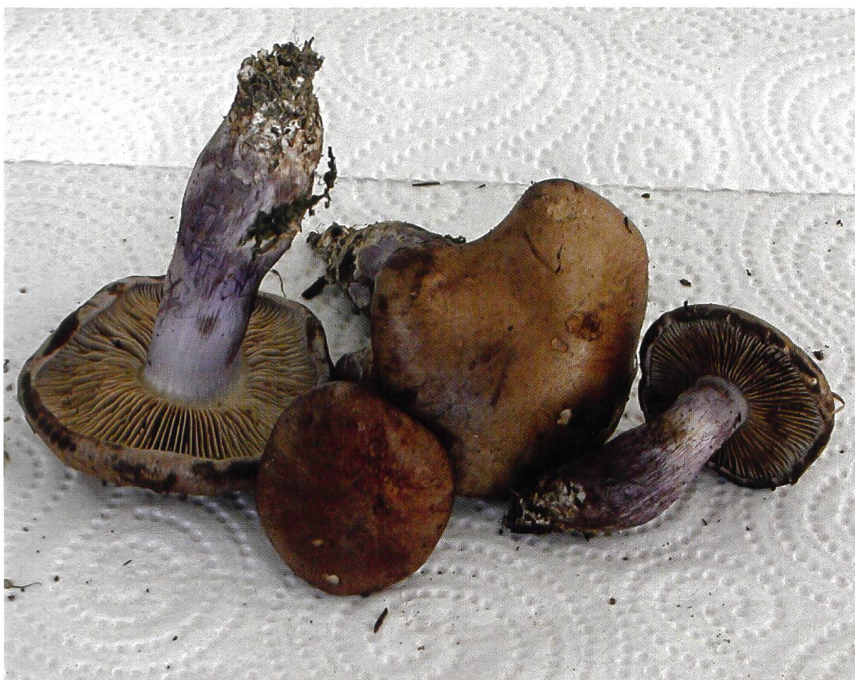
CORTINARIUS (PHLEG.) VIOLACEOMACULATUS Fruchtkörper | Fructifications

Spores caractéristiquement petites, elliptiques à amygdaliformes, fortement verruqueuses, (7-)-8-10 × 4-5 µm.