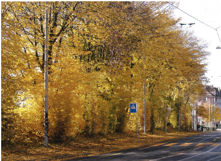
Abb. 1 Baumhecke in der Stadt Bern mit Hagebuchen ill. 1 Allée boisée de charmes dans la ville de Berne