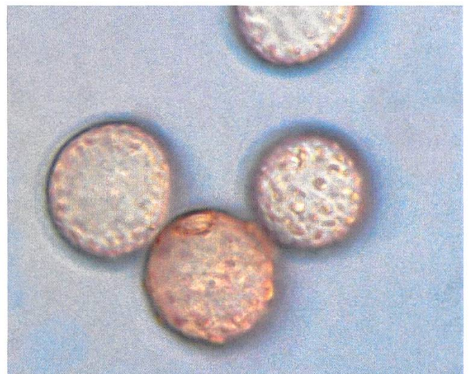
Hypocreopsis lichenoides Chlamydosporen