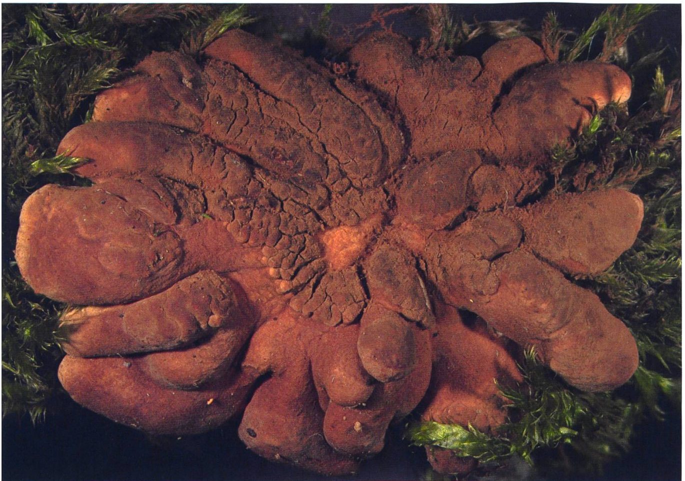
Hypocreopsis lichenoides Fruchtkörper

Chlamydosporen > 8–12 µm, globos, blass braun.