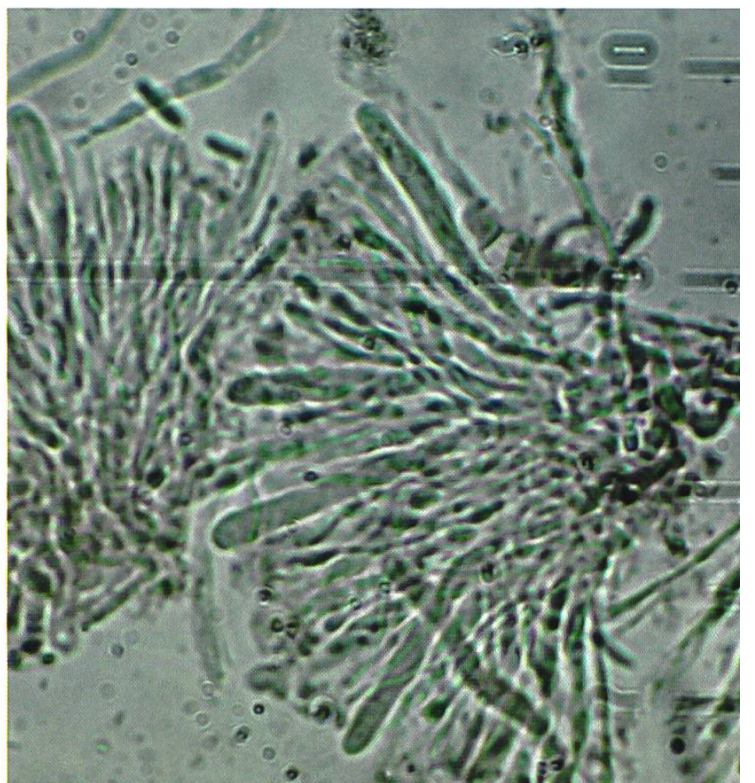
Ionomidotis fulvotिंगens Aschi e parafisi