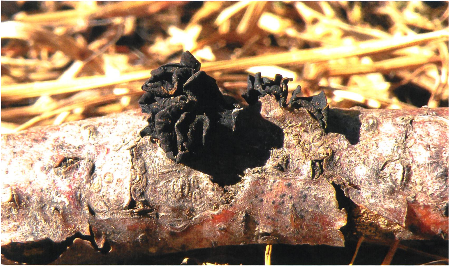
Ionomidotis fulvotिंगens Fruttificazione