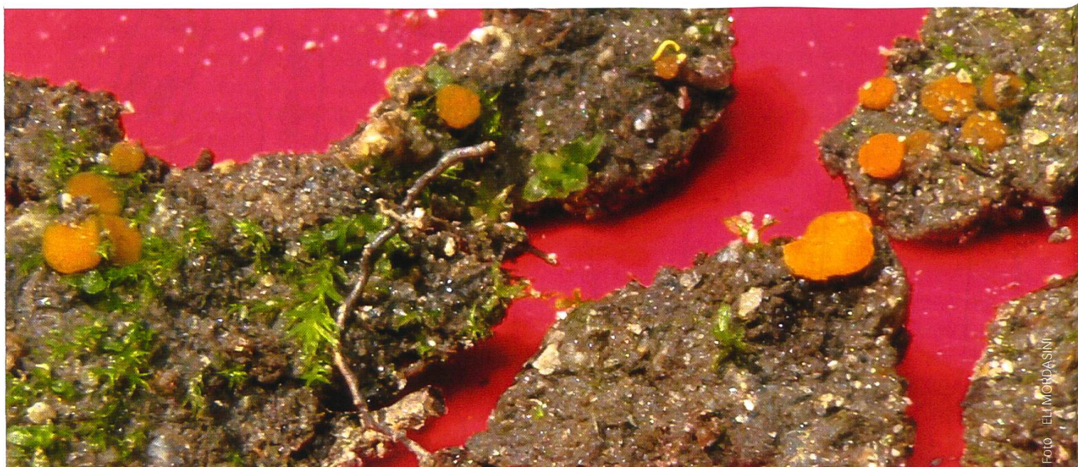
Ramsbottomia macrantha Apoteci in habitat | Apothezien