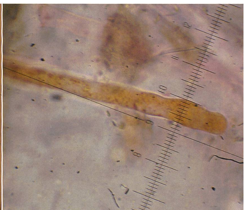
Ramsbottomia macrantha Parafisi | Paraphysen