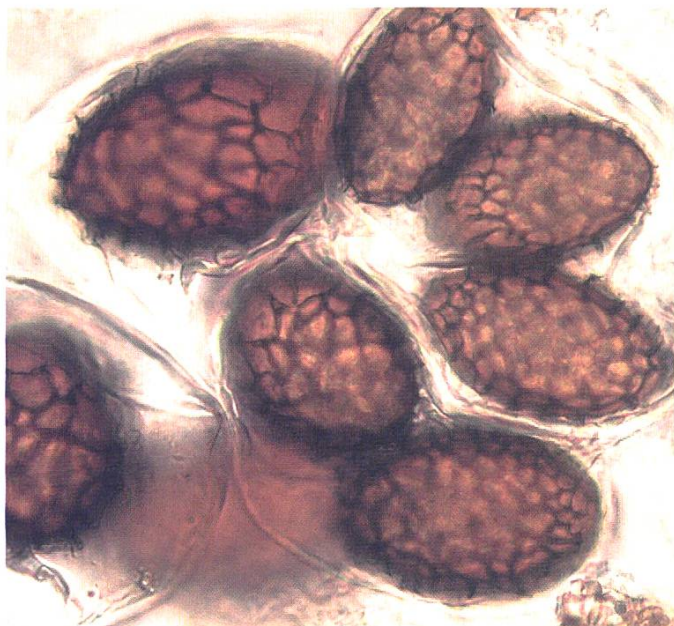
Tuber macrosporum : Sporen.

Sind die rotbraunen, gekammerten Pilzchen von 0,5 bis 2 cm tatsächlich selten oder werden sie schlicht