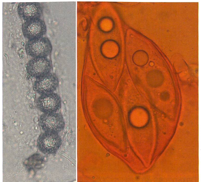
Genea verrucosa und Picoa carthusiana : Sporen.