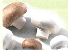
Champignon de Paris