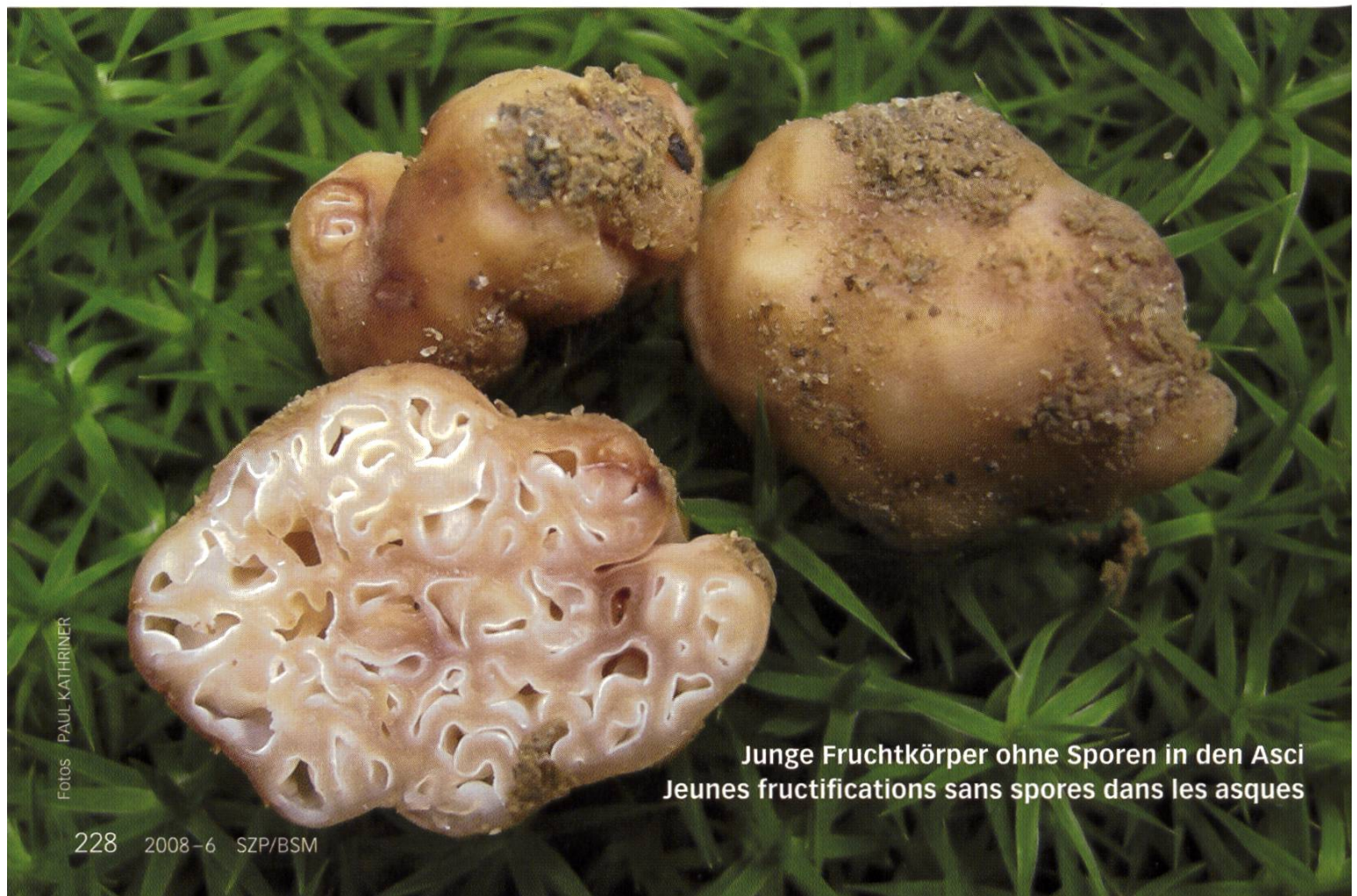
Junge Fruchtkörper ohne Sporen in den Asci Jeunes fructifications sans spores dans les asques

Sporen > 20–30 µm ohne Ornamente, reif rötlichbraun, rundlich, grob warzig mit Placken und Lappen.