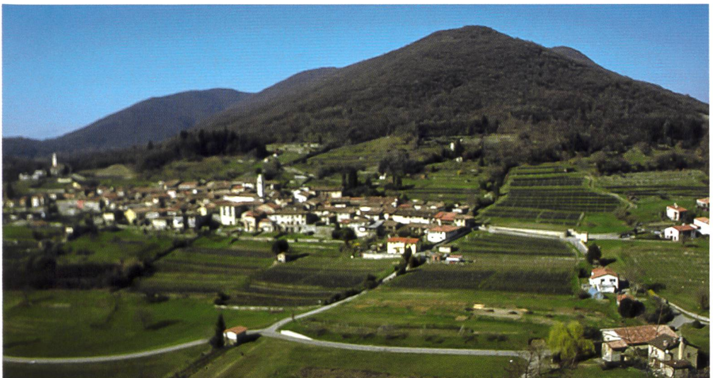
Meride sede Museo e visitor center

1994, qui ont trouvé des espèces particulièrement intéressantes (documentés et déposés dans des herbiers), sont cordialement invités à nous envoyer leurs données jusqu'au 31 décembre 2007. Ces informations seront ajoutées aux 1200 espèces déjà recensées dans cette région intéressante de seulement 25 km 2 et déposées dans les herbiers de LUG et INO.