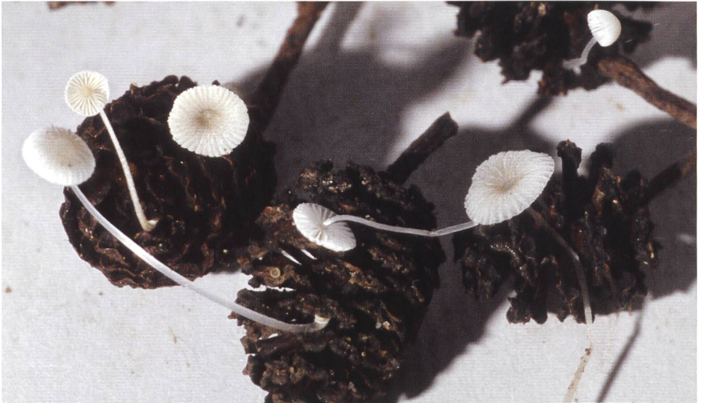
Mycena rhenana auf Erlen-Zäpfchen | sur strobiles d'aulnes