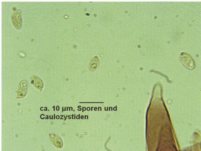
Sporen | Spores