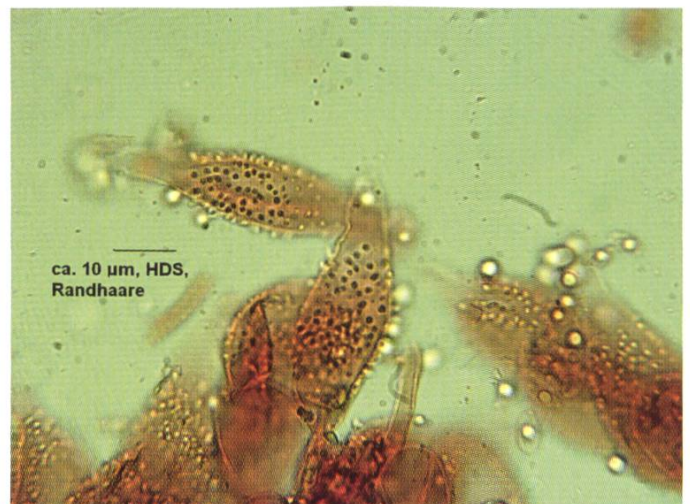
Hutdeckschicht (l), Randhaare (r) | Revêtement piléique (g), poils (d) (in Kongorot gefärbt | colorés dans rouge congo)