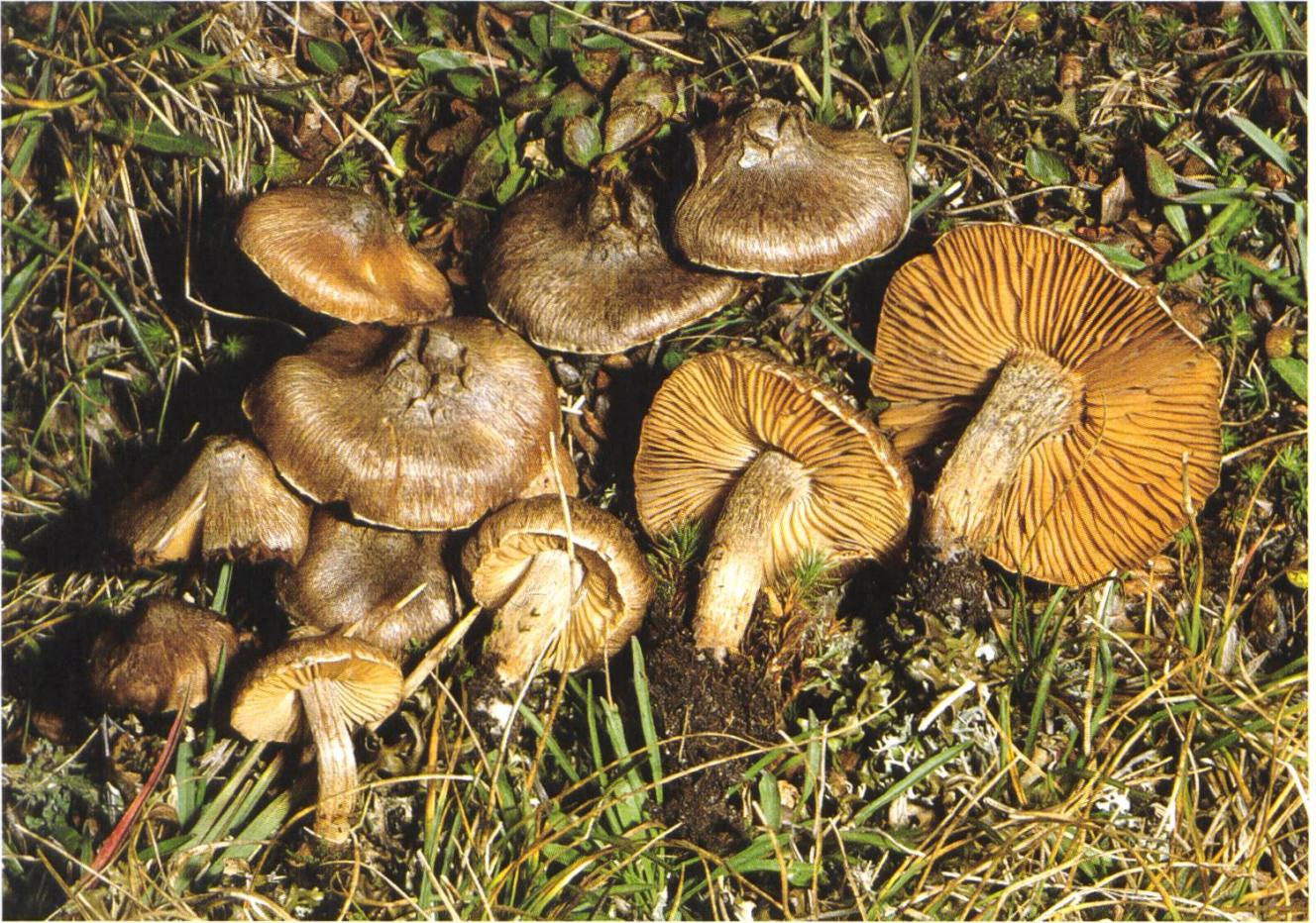
Incocybe johanna (5. 9. 1999)