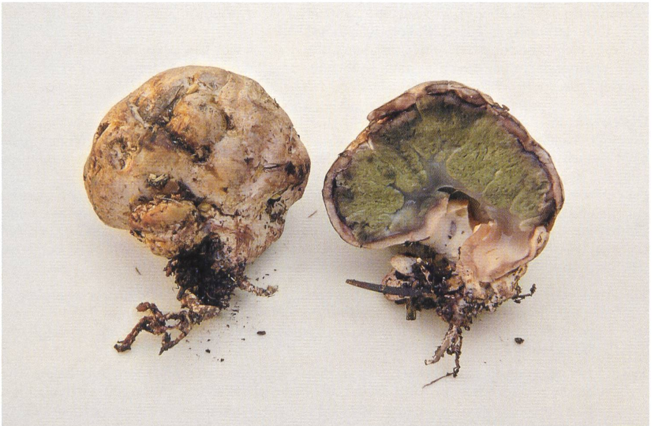
Phallogaster saccatum , Stinkender Sackbovist