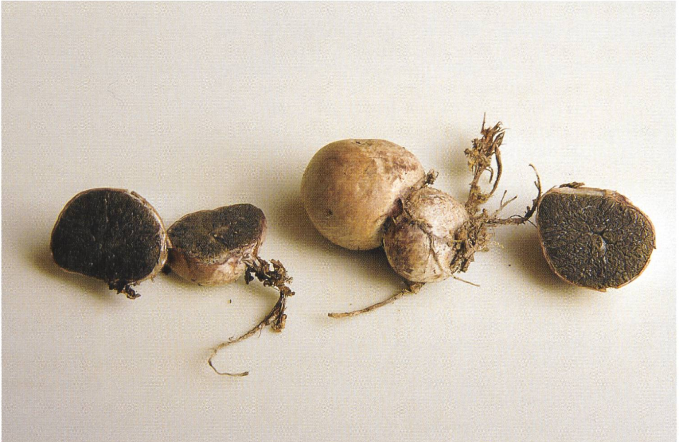
Hysterangium crassum , Kräftige Schwanztrüffel