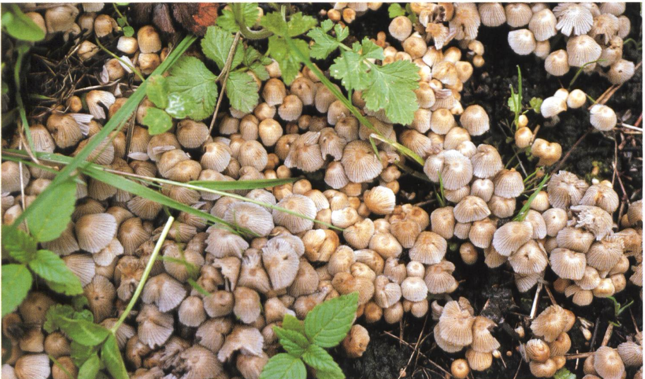
Coprinus disseminatus , Gesäter Tintling