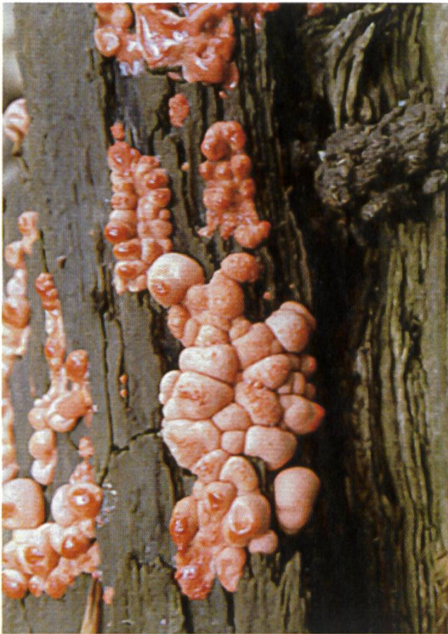
Lycogala epidendron

Um 1973 gab es in den USA in der Umgebung von Dallas, Texas, ein extremes Vorkommen von Fuligo septica in einem Wohnquartier. Die grossen gelben Plasmodien, die in den Gärten wucher-