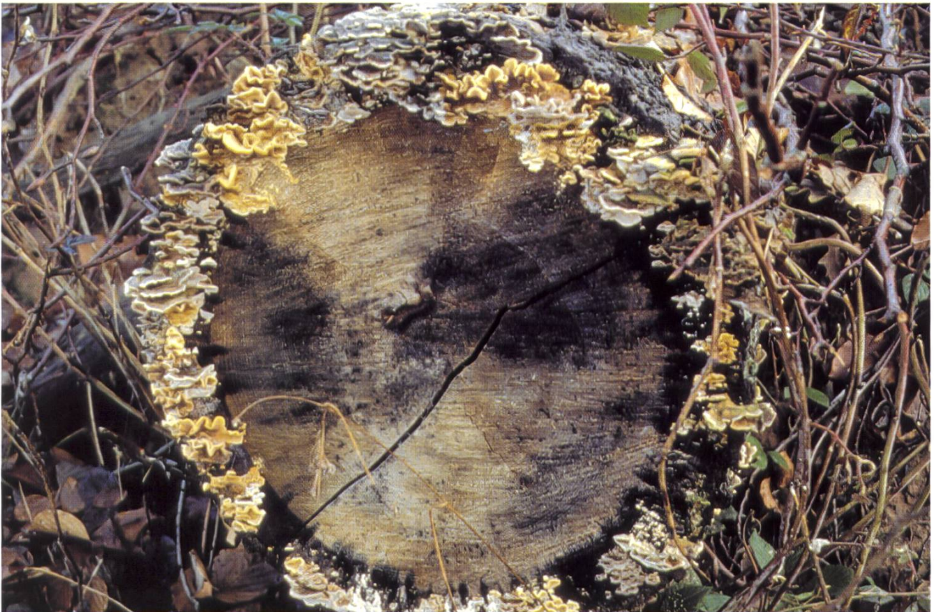
Bild Nr. 2: Bei der Eiche sieht die Sache anders aus. Zunächst wird der breitere Splintholz-Zylinder von den Pilzen besiedelt und abgebaut. Das Kernholz ist durch Einlagerung von Pilzbefall hemmenden Substanzen (Harze, Öle, Tannine usw.) so resistent, dass es von aussen her nur ganz langsam, fast jahringweise, aufgelöst wird.