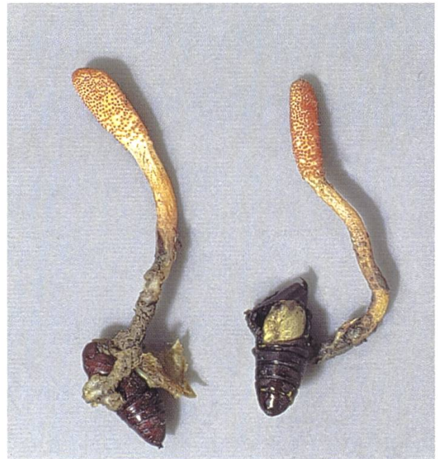
Cordyceps militaris , Puppenkernkeule