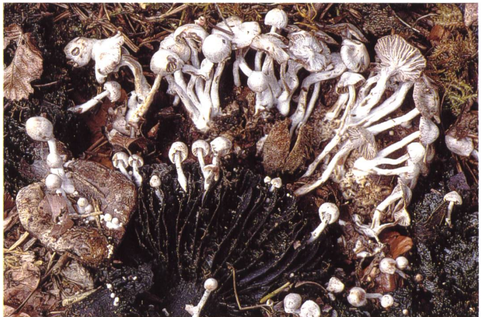
Nyctalis parasitica , Parasitischer Zwitterling