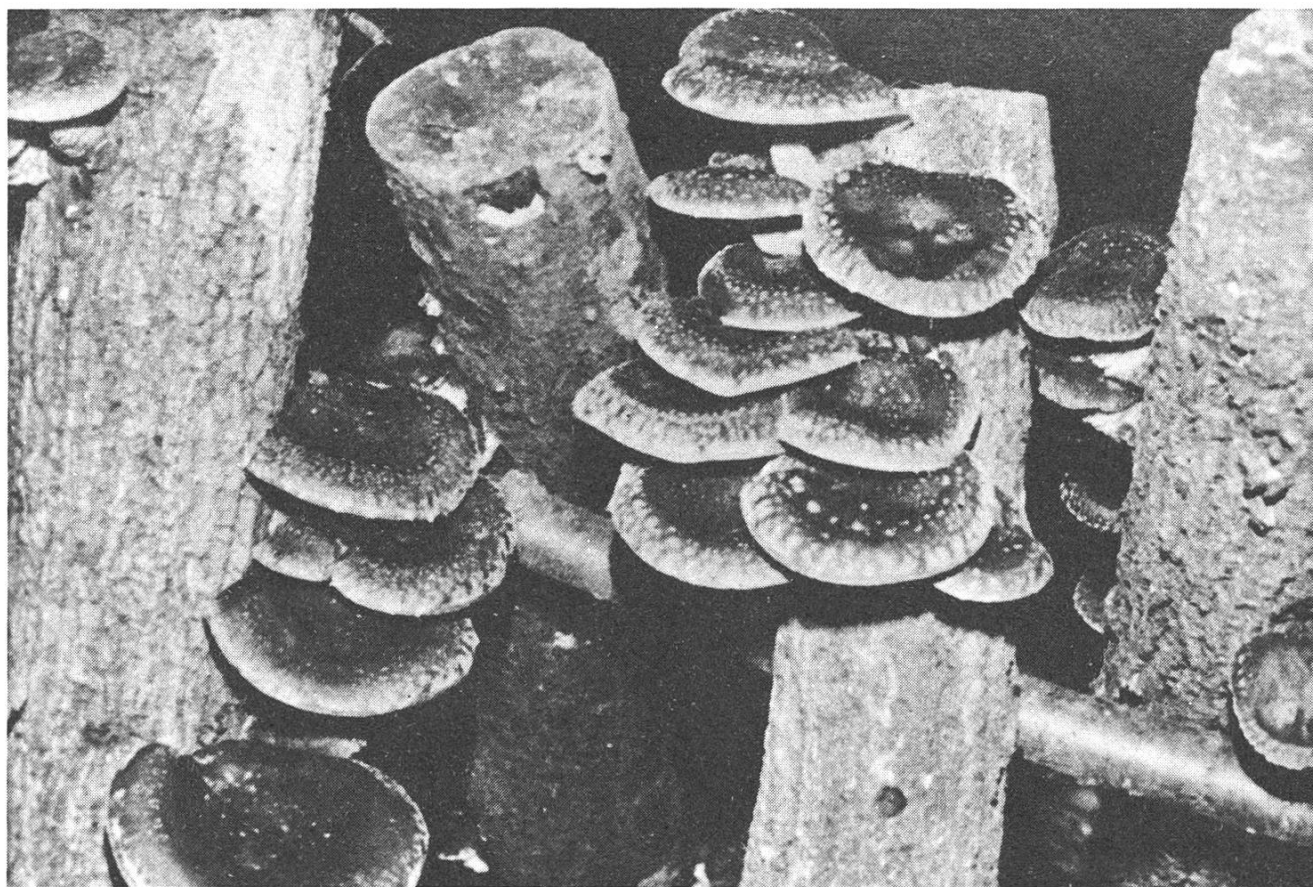
Gezüchtete Shiitake-Pilze auf Holz.