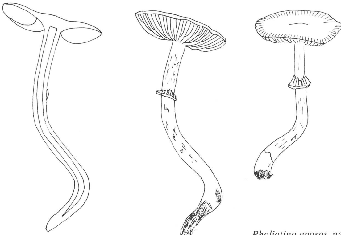
Pholiotina aporos , natürliche Grösse.