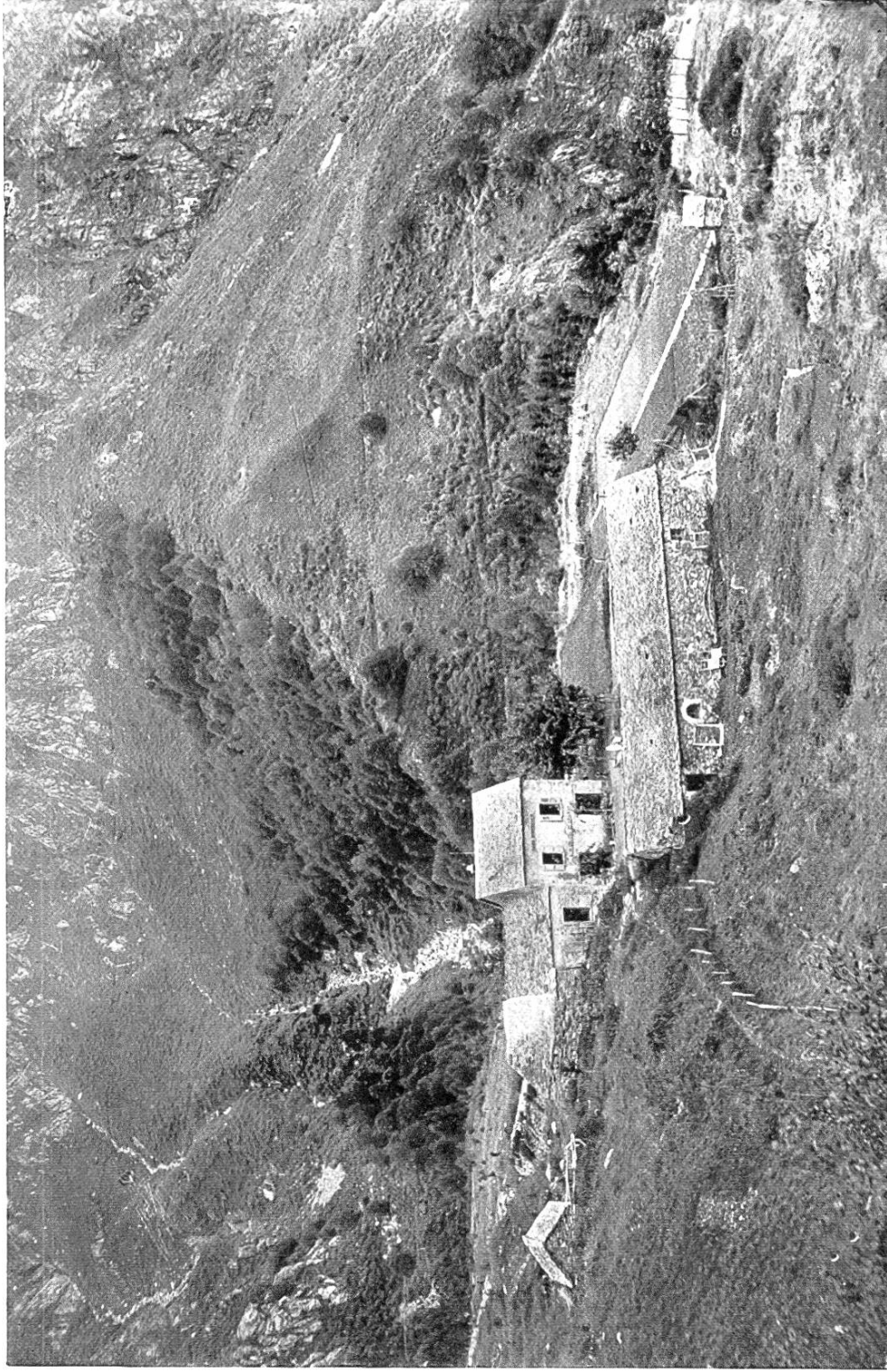
Abb. 2. Das Forsthaus auf Alp Cufello (1348 m ü. M.), im Zentrum des Aufforstungsgebietes Aufnahme 1924