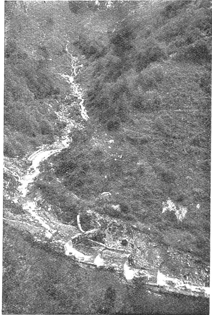
Abb. 3. Verbauungen im Cujellobach Aufnahme 1924

Schon kurze Zeit nach Ankauf und Aufhebung der Weiden machte sich eine auffallende Besserung der Abflußverhältnisse bemerkbar. Der Regender, früher an den gründlich abgeweideten Hängen rasch oberflächlich abfloß, bildete in kürzester Zeit Wildbäche von stromartigem Verlauf; die nun geschonte Grasnarbe nimmt beträchtliche Quantitäten Wasser auf, sie stellt ein, wenn auch nur unvollkommenes Reservoir dar. Von Jahr zu Jahr nun werden sich die Verhältnisse mit zunehmender Uberschirmung des Bodens durch den heranwachsenden Wald weiter bessern. Wertvolle Aufschlüsse hierüber liefert die Wassermessstation an der Grenze des Einzugsgebietes, in der von einem besondern Aufseher das täglich abfließende Quellwasser, sowie dessen Temperatur festgestellt wird und die zugleich für die meteorologische Zentralanstalt in Zürich die Niederschläge ermittelt. Nach den seit 1897 vorliegenden Beobachtungen ist der mittlere Quellertrag 4200 Minutenliter. Den geringsten Zufluß von 1080 Litern lieferte bis heute der Monat Februar des Jahres 1922. Mit ihm nahm eine sechsmonatige Trockenperiode ihr Ende. Die jährliche mittlere Niederschlagsmenge beträgt 1057 mm.