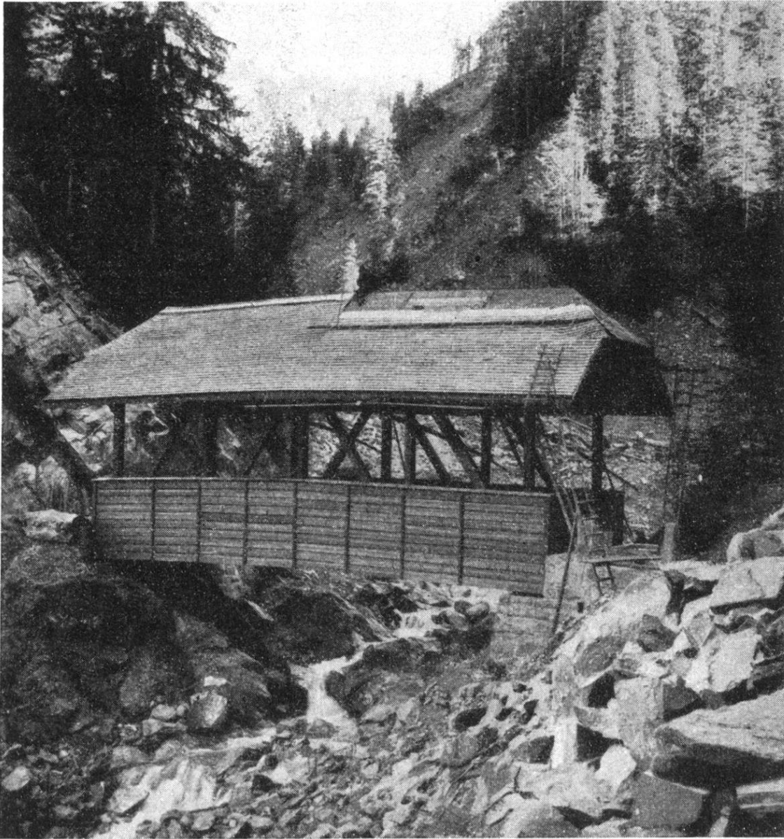
Le pont du Hœllbach, vu de flanc.

Le tavillonneur est en train d'achever la couverture du toit.