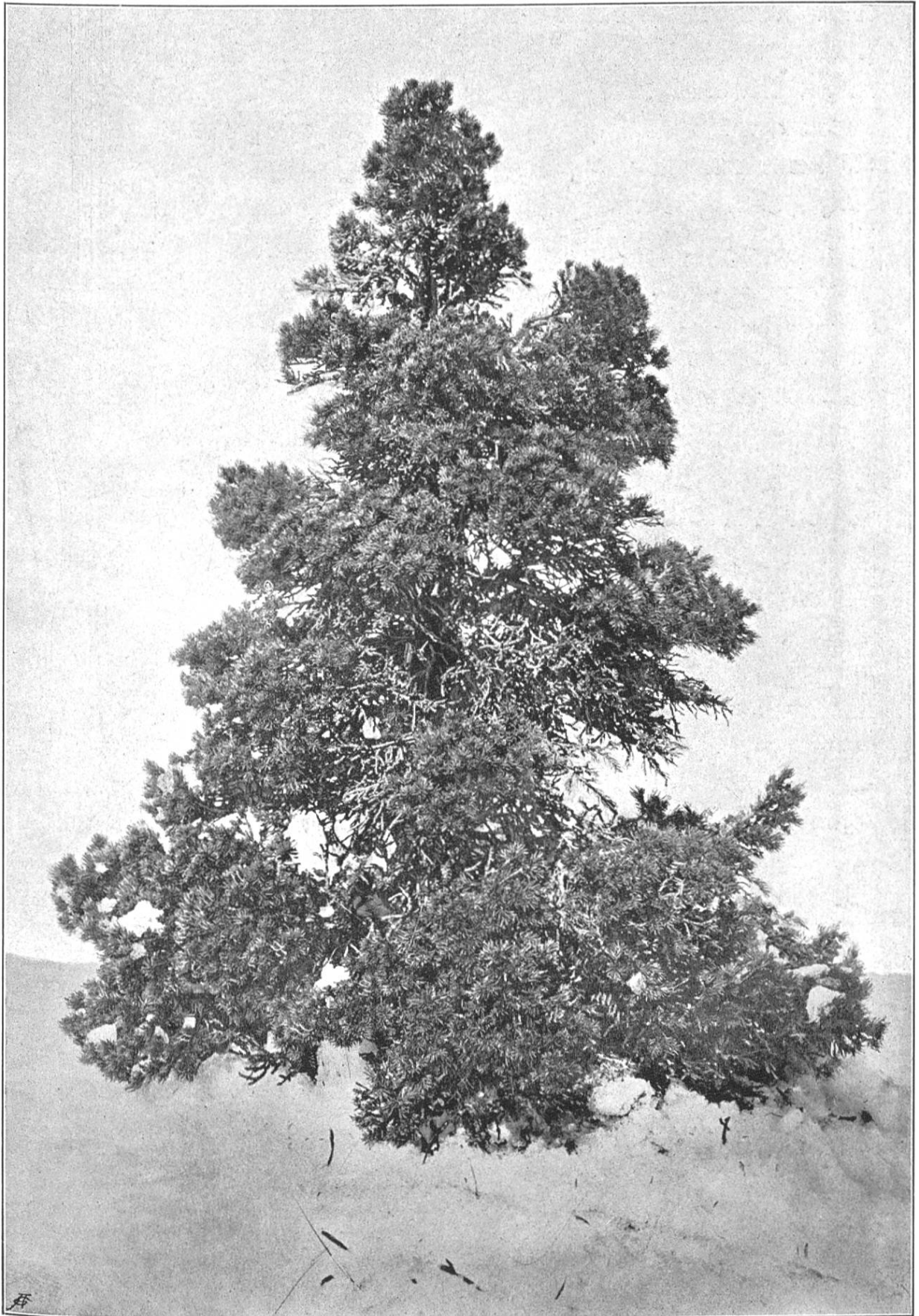
Epicéa nain de Vaulion.

( Lusus nana Carrière, sublusus brevis Schröter.)