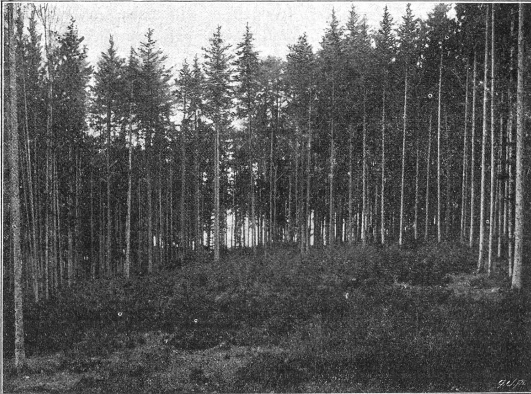
Rajeunissement par groupes.

En Suisse , dans nos forêts généralement mélangées de résineux et de feuillus, l'on applique depuis longtemps et avec succès la régénération lente et le rajeunissement par groupes et en pla-