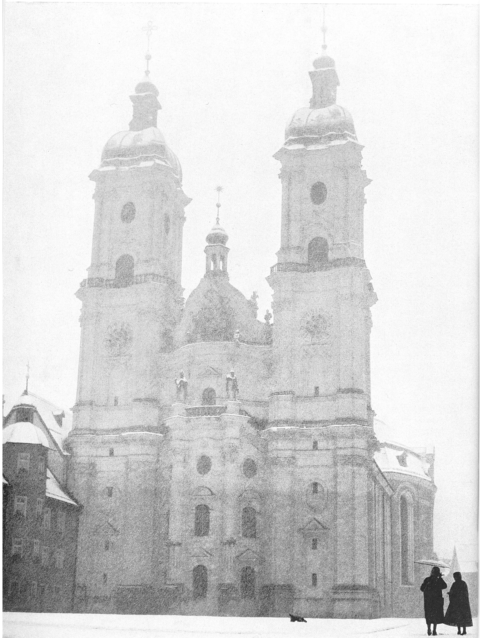
La cattedrale di San Gallo, pregevole edificio barocco.