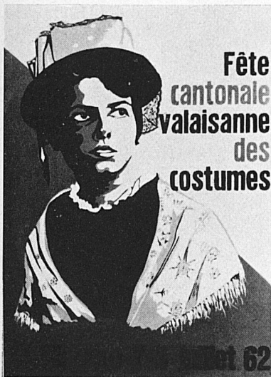
St-Maurice, 7/8 juillet 1962

Juin: 21. Procession de la Fête-Dieu. 1 er juillet/30 sept. Tous les soirs: Spectacle «Sion à la Lumière de ses Étoiles». Toute l'année. Musée de Valère: Archéologie, histoire et folklore du Valais. Eglise fortifiée. Orgues 1450. Musée de la Majorie: Beaux-arts, collections cantonales. Maison Supersaxo: Célèbre plafond de Jacques de Malacridis 1505.