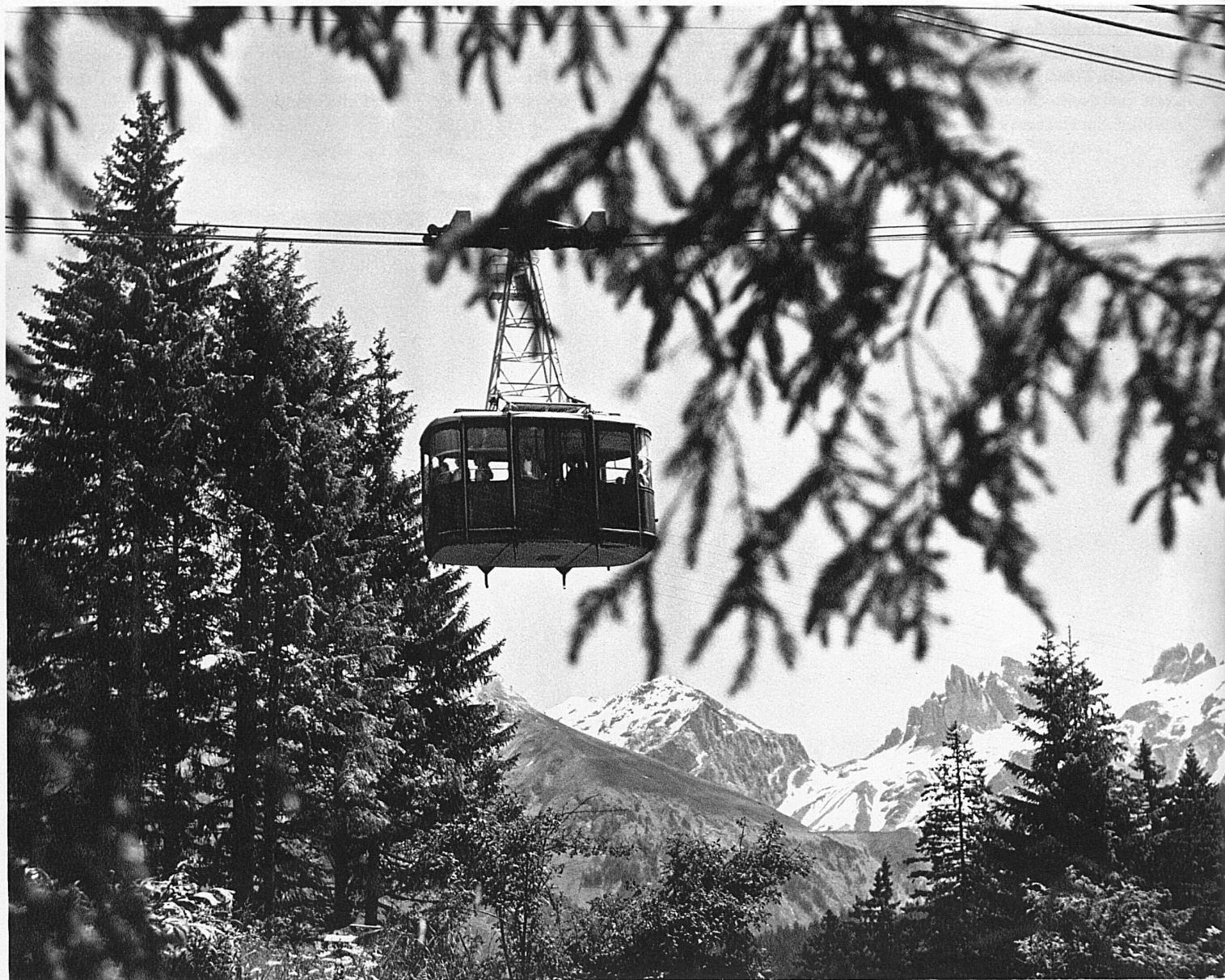
Die Luftseilbahn Gerschnialp-Trübsee über Engelberg in der Innerschweiz Le téléphérique Gerschnialp-Trübsee, au-dessus d'Engelberg (Suisse centrale) La teleferica Gerschnialp-Trübsee sopra Engelberg, nella Svizzera centrale The cable-car from Gerschnialp to Lake Trübsee above Engelberg in Central Switzerland El funicular aéreo de Gerschnialp a Truebsee, encima de Engelberg, en la Suiza central