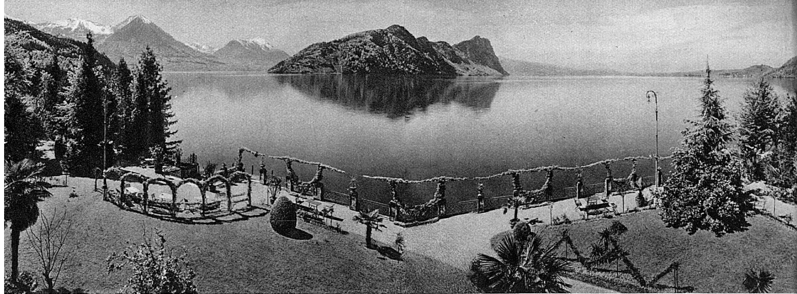
In het land der bergen en meren! Gezicht van het hotel Vitznauerhof te Vitznau op het Vierwoudstedenmeer, den Buchserhorn, den Stanserhorn en den Bürgenstock

weg langs den Rijn volgen, waaraan wellicht de meerderheid onzer toch de voorkeur geeft. Is er een heerlijker voorspel tot een Zwitsersche reis denkbaar dan deze tocht langs den machtigen, breedten Rijn, omgrens'd door steeds hooger wordende bergen, door oude stadjes en oude burchten?