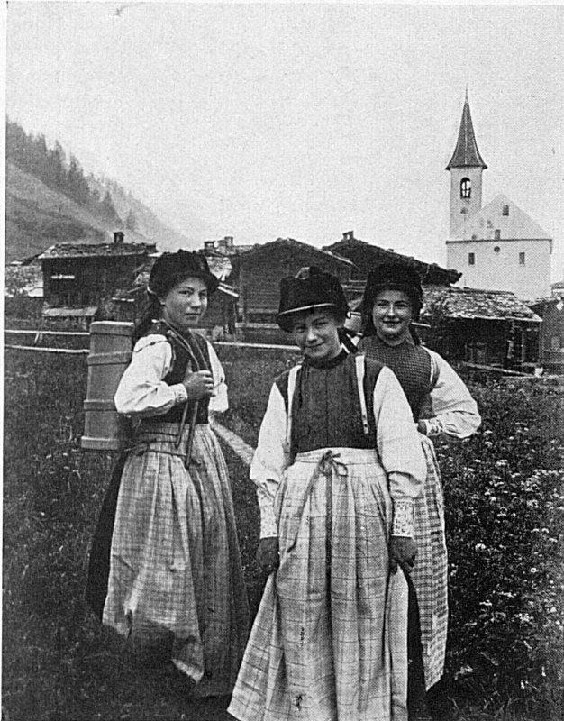
Im Lötschental / Dans la vallée de Latschen

Un tel effort, de si louables sacrifices, méritent certes la reconnaissance des autorités et du public, et il faut espérer que les foules accourront de tout le canton et