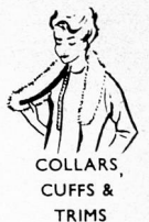
COLLARS, CUFFS & TRIMS

"Velcro" touch and close fastener (a Swiss inven- tion) is made of two Bri- nylon strips which grip firmly at a touch, yet easily peel apart. "Velcro" can be cut with scissors to any length. You can sew it on by hand or machine. It can be washed and dry-cleaned. Can- not jam or rust.