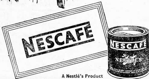
A Nestlé's Product

Nescafé is a soluble coffee product composed of coffee solids, with dextrins, maltose and dextrose, added to retain the aroma.