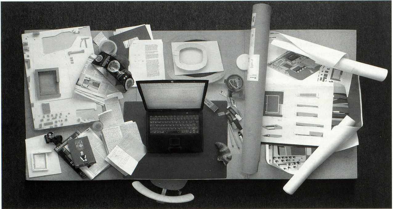
Ganz normales Wuchern, Lambda auf Dibond, 210 x 125 cm

Reise auf Spitzbergen im Januar 2006 sei eine Art Fortsetzung dieses frühen Experiments gewesen, erzählt er, mit dem Unterschied freilich, dass er diesmal vor allem geschrieben habe.