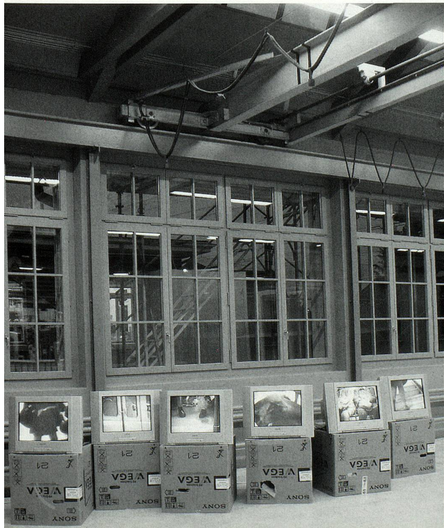
Paris Beats, Video-/Soundinstallation, 1998 (6 von 18 Teilen)

In den nun mehr und mehr als öffentliche Aktionen wahrnehmbaren «Werken» sind zwei – in gewissem Sinn gegenläufige – Charakteristiken erkennbar. Zum einen ist es – erstaunlicherweise – eine Art Darstellung des Auf-sich-selbst-angewiesen-Seins bis hin zu extremen Experimenten. So liess er sich zum Beispiel im Jahr 2000 während zweier Wochen in einen nie benutzten Bunker in der Stadt Bern aus den 1920er-Jahren einsperren, um zu ergründen, was man macht, wenn es nichts zu machen gibt. Mit der Videokamera hält er fest, wie er sich in den Räumen ohne Sinn und Zweck bewegt, wie er Grimassen schneidet, mit sich selbst spricht ... Am Ende der Aktion lädt er ein, die «Gemächer» zu besichtigen, in denen er zwei Wochen nichts getan hat. Zu sehen ist: nichts. Die