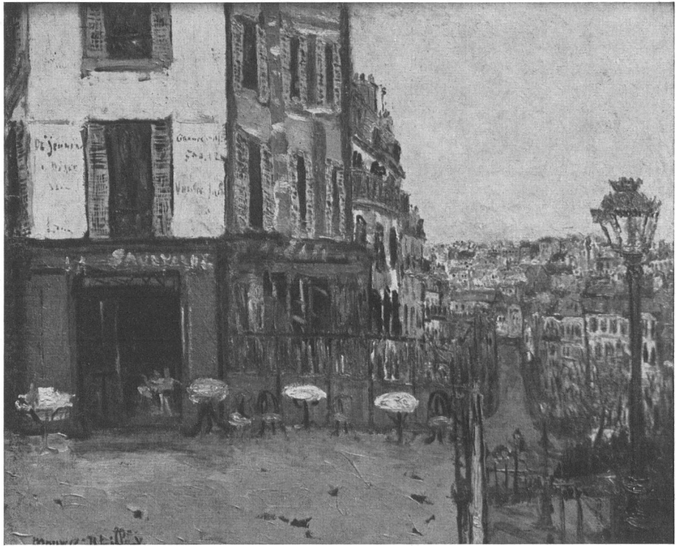
Terrasse de la rue Mulle 1912