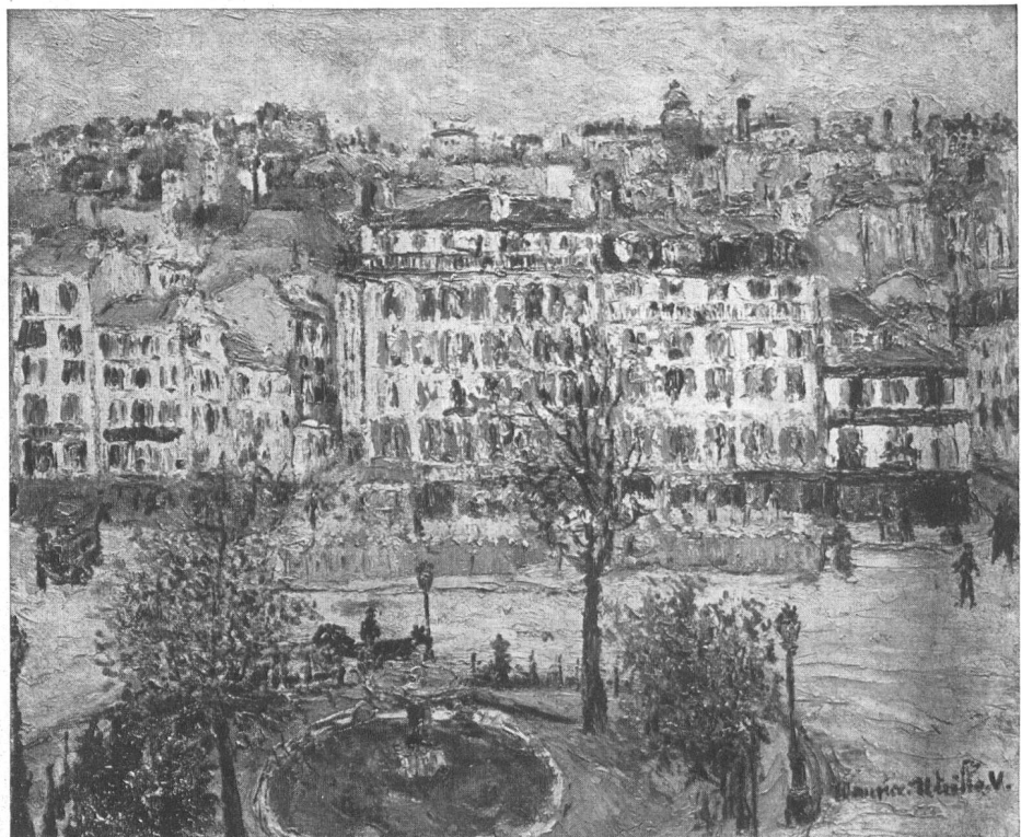
La Place Clichy, 1909/10