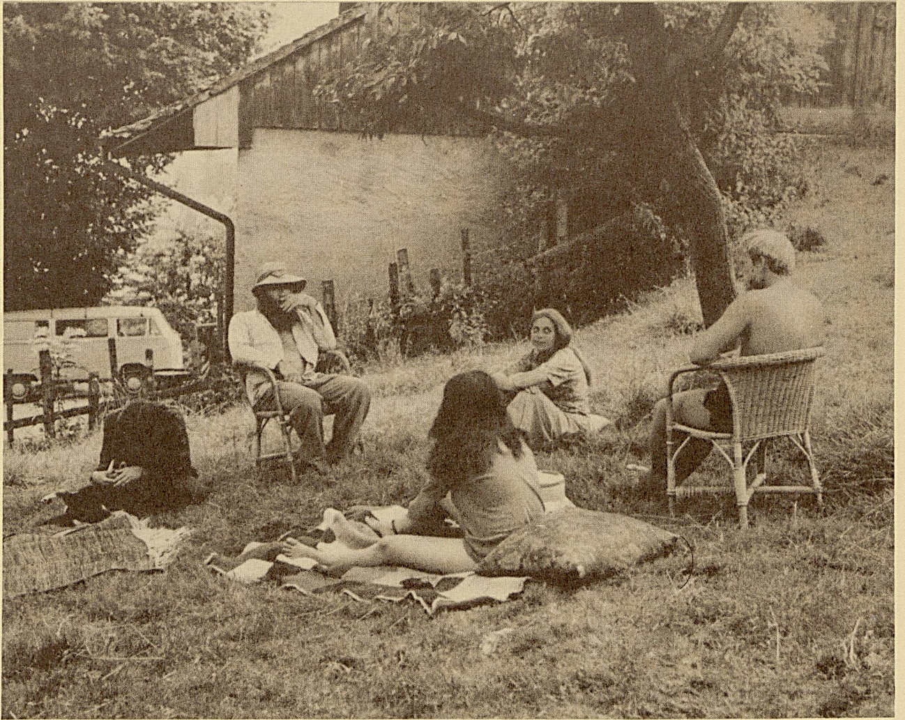
Gruppentherapie im Sommer