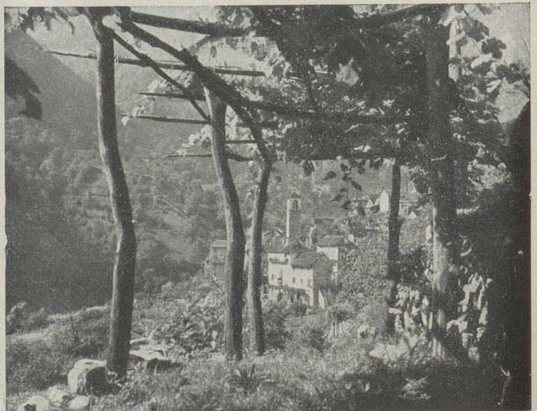
Village dans le Val Verzasca

Les communes où cette diminution se remarque le plus, — Ascona et Orselina l'ayant depuis longtemps, — sont Castagnola, Ronco-sur-Ascona, Agra, même si le pourcentage étranger de leur population a légèrement diminué. Toutefois la liste des communes déficitaires, en tant que population tessinoise, vient de s'allonger. Mélide et Bissone, communes charmantes des rivages du lac de Lugano, voient leur population augmenter, mais ce ne sont pas de nouveaux berceaux tessinois qui la fournissent... Ce sont des amoureux de leurs beautés naturelles qui viennent vivre dans ces lieux enchantés. Il en est de même de Muralto, Carabbia, Pambio-Noranco, Sorengo, Paradiso, Minusio, Morcote, Vico-Morcote, Chiasso qui ont tous une population tessinoise en nombre inférieur et un pourcentage d'environ 60 % d'étrangers ou confédérés. Chiasso, qui est une petite ville frontrière, n'est pas dans la joute : il est compréhensible qu'il en soit ainsi. Et il en est de même pour des communes qui, du fait de leur industrialisation, comptent dans leur population un grand nombre d'étrangers et de celles, qui étant très appréciées par les beautés de leur configuration naturelle, attirent le monde. Mais comment expliquer, par exemple l'excédent de Pambio-Noranco, de Carabbia, communes où sans doute il fait bon vivre, mais qui n'ont pas