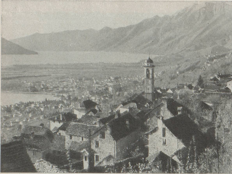
Locarno vue de Brione