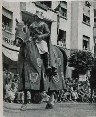
Berthold IV de Zähringen, premier seigneur attiré de ces lieux, fonda Fribourg en 1157.