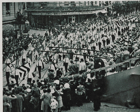
L'impesant défilé des drapeaux des 284 communes fribourgeoises terminait le cortège