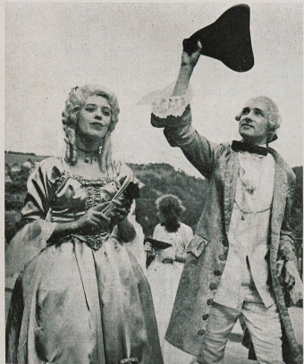
Dans les siècles passés, l'aristocratie fribourgeoise joua un rôle important, non seulement dans la vie de la cité, mais dans celle du pays. Portant perruques, tricornes et belles robes du temps passé, elle figurait aussi dans le merveilleux cortège.