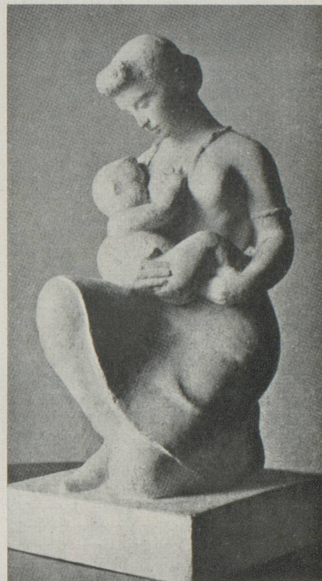
Jean-Daniel Guerry : Maternité

Le 6 juillet, au Théâtre de Chaillot, un concert a été donné à l'occasion du Congrès International de musique sacrée, avec le concours du chœur « La Schola Romande ».