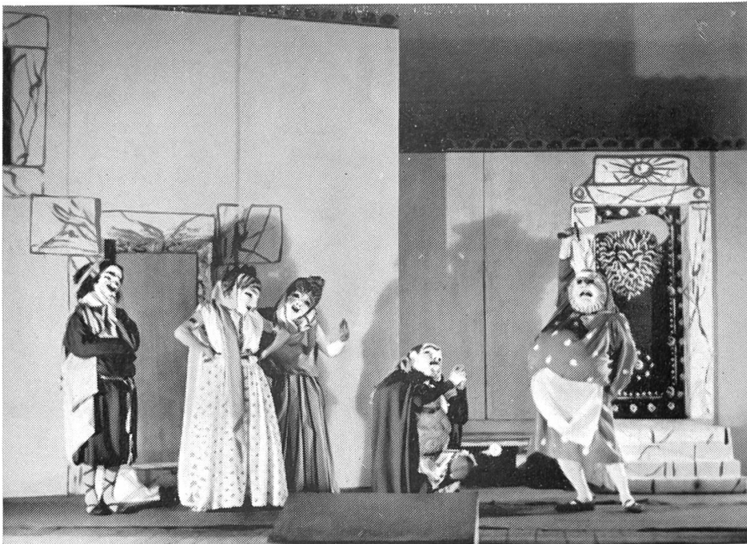
21. Stadttheater St. Gallen (Winterspielzeit 1947/48)

Oberst Schilter und Hauptmann Kyd disputieren über die Geschenke, die sie dem Agathli aus dem Welschland heimbringen. Freunde des Volkstheaters, Wädenswil