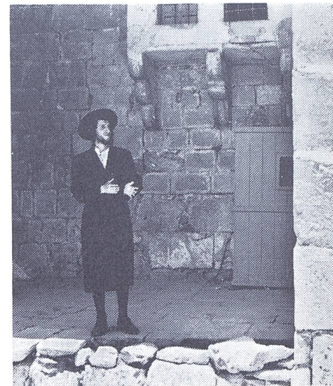
Rückkehr in Jerusalems Altstadt

Wir sehen zusammen die heiligen Stätten, den neuen Staat im Aufbau, israelische und arabische Ortschaften, herrliche Landschaften, Ruinen uralter menschlicher Siedlungen und den Kampf gegen die Wüste im Kibbuz. Vier Tage stehen zur freien Verfügung in Jerusalem und im herrlichen Meerbad Natania. Die Reise ist gemütlich und nicht gefährlicher als jede Ferienfahrt in Europa.