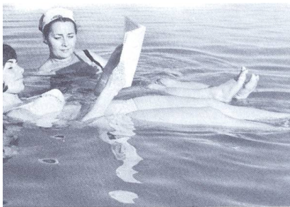
Im Toten Meer fühlt man sich leicht

Es sind noch Plätze frei — Anmeldungen noch möglich bis acht Tage vor der Abreise