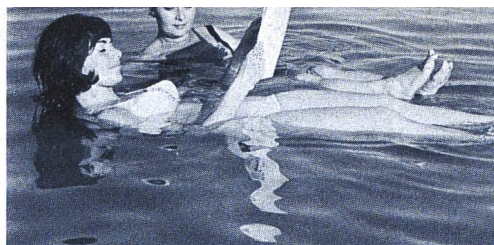
Im Toten Meer fühlt man sich leicht

Für die Leser des Schweizer Spiegel organisieren Israel Tours fesselnde und erholsame