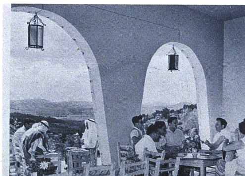
Restaurant in Abu-Gosh

Es sind noch Plätze frei, Anmeldefrist 2. August.