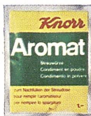
Knorr Nachfüllbeutel für Aromat und Diät-Aromat