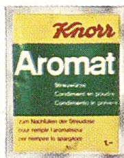
Knorr Nachfüllbeutel für Aromat und Diät-Aromat