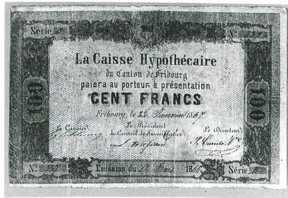
10| Banknote zu 10 Franken, Banque populaire de la Broye, 25. März 1865. 11,3 x 19 cm. M 15066.