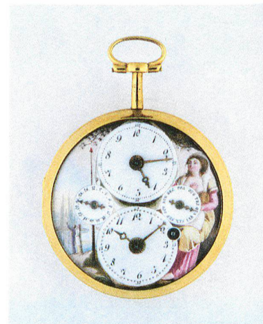
1| Montre de poche avec l'horaire de la Révolution et l'indication du calendrier, anonyme, 1795. Boîtier en or, cadran en émail, peint. Hauteur 7,3 cm, Ø 5,3 cm. LM 81984.

Les horlogers se sont accommodés de ce nouveau besoin et à l'annonce de l'introduction du système décimal de la division du temps, ils ont immédiatement fabriqué de nouvelles montres. La plupart d'entre-elles indiquent aussi l'ancienne mesure afin de pouvoir convertir le temps (par exemple, dix heures dix du matin correspond à quatre heures vingt-quatre), mais l'adaptation est peu aisée. Parfois les montres sont même décorées d'emblèmes et de symboles de la Révolution. Cela est aussi le cas pour la montre de poche en or qui a été ac-