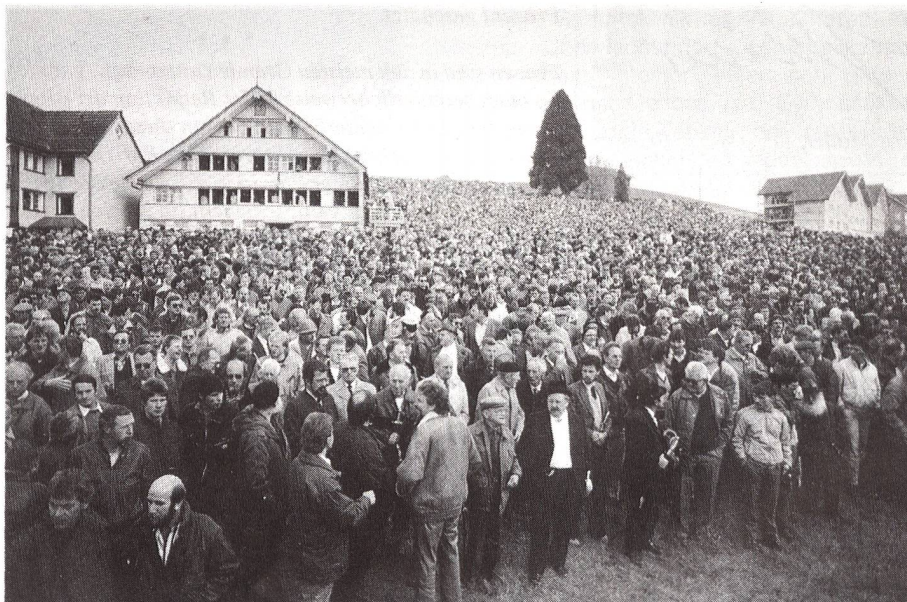
Historische Landsgemeinde von Hundwil (Appenzell-Ausser rhoden) vom 30. April 1989: Frauen endlich gleichberechtigt.