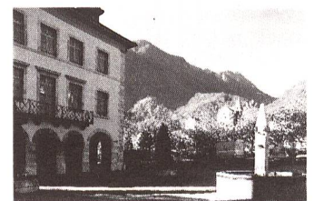
Vouvry VS

Heimat zum Ort der Versorgung im Notfall erklärte, hat vielen Menschen Schwierigkeiten gemacht und diese Heimat