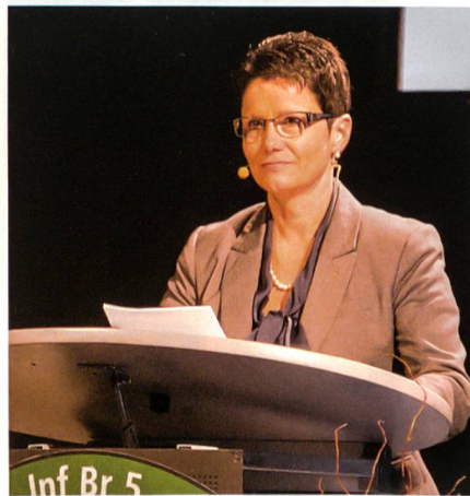
Die Obwaldner Regierungsrätin Maya Büchi bekennt sich zu Sicherheit und Stabilität der Schweiz.