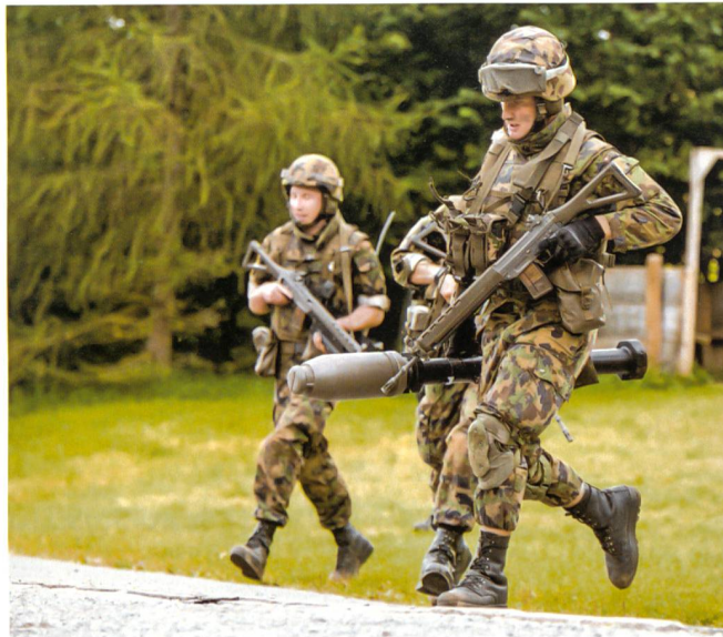
Panzergrenadiere mit dem Sturmgewehr und der Panzerfaust.