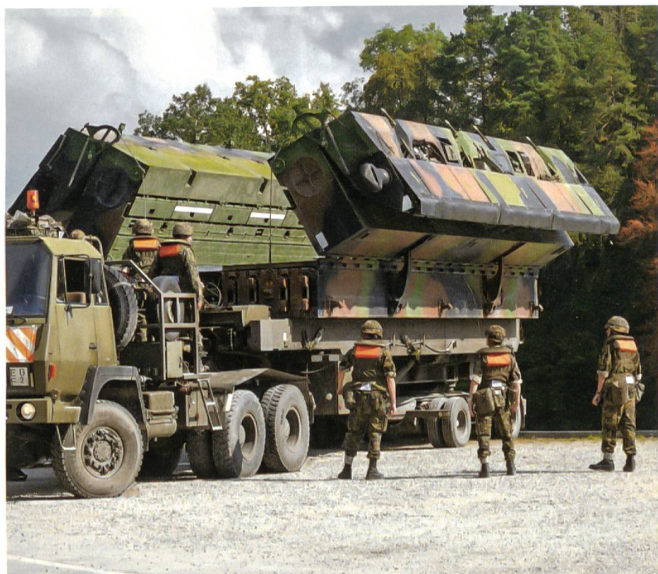
Beim Paul-Scherrer-Institut: Pontoniere bereiten Fähre vor.