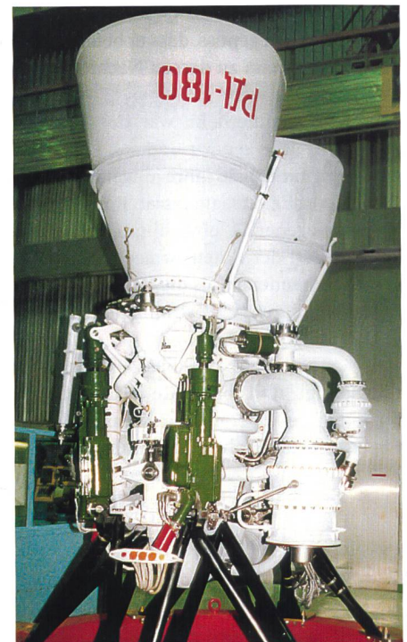
RD-180-Modell an der MAKS 2013. Die rote Aufschrift steht auf dem Kopf und heisst kyrillisch RD-180.