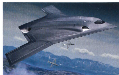
Das Konzept von Northrop Grumman.

Bei dem Grossauftrag setzte sich Northrop Grumman gegen ein Bündnis der früheren Rivalen Boeing und Lockheed Martin durch. Sollten alle 100 vorgesehenen Maschinen gebaut werden, summiert sich der Auftragswert auf 80 Milliarden Dollar.