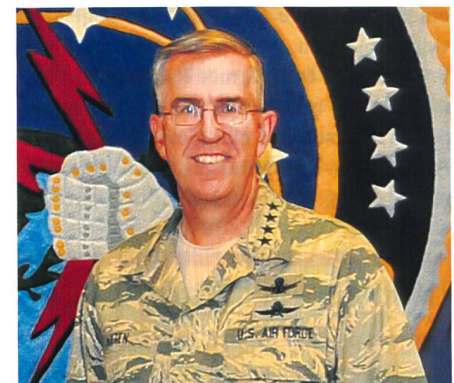
General John Hyten ist seit dem 15. August 2014 Befehlshaber des Air Force Space Command (AFSPC), eines Kommandos der US Air Force mit Sitz auf der Peterson Air Force Base, Colorado.

Befürchtet werden Verzögerungen in den amerikanischen Satellitenprogrammen. Betroffen wären indessen nicht nur eigene Programme, sondern zum Beispiel auch Mexiko. Für Mexiko lancierte das Space Center am 2. Oktober 2015 erfolgreich den Morelos-3-Satelliten.