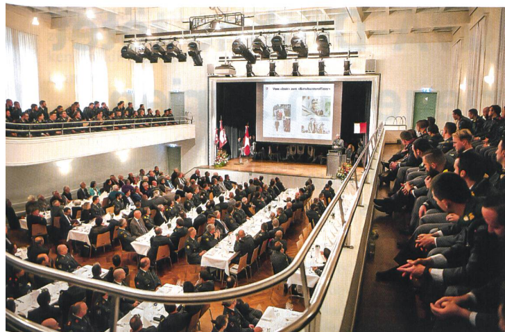
Für die Berufsunteroffiziersschule der Armee ein grosser Tag!