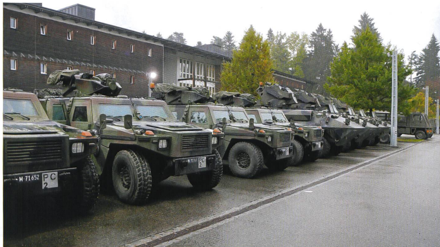
Friedlich vereint: Die Eagle-Aufklärer und die Piranha-Panzerjäger.

Die Übungsanlage sah vor, dass eine tiefgreifende Wirtschafts- und Energiekrise die Feindseligkeiten zwischen zwei fiktiven Ländern nördlich respektive östlich der Schweiz eskalieren lässt. Zu befürchten war daraufhin ein Stoss dreier gegnerischer mechanisierter Brigaden durch Schweizer Hoheitsgebiet. Diesen erwartete die vorgesetzte Kommandostufe entlang dem Bodensee von Arbon über Romanshorn nach